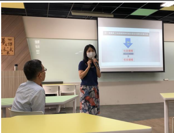
講師分享性平事件通報之相關法律規範