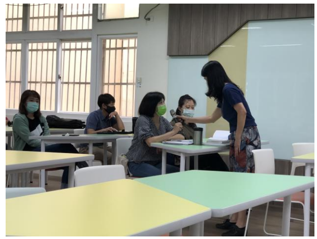
講師與校內教師互動，了解性平教育融入教學之實施現況