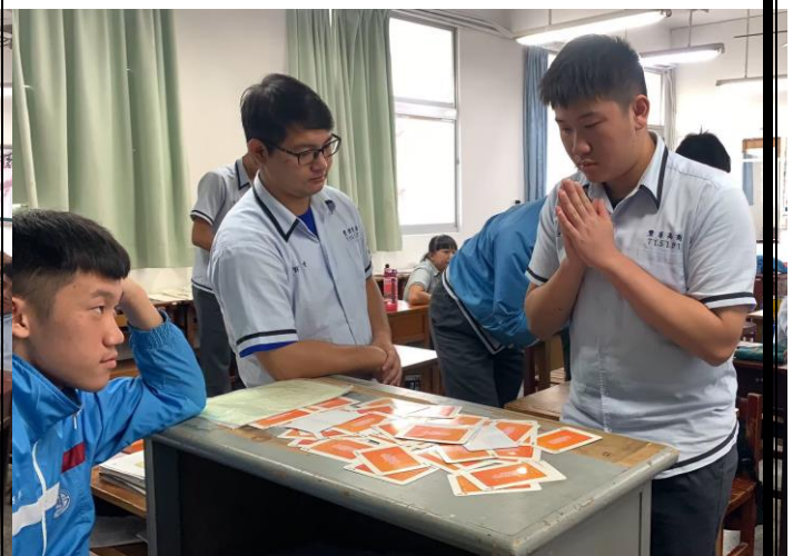
每位同學輪流抽卡，感受正向小語與心靈的神奇相應，也從中獲得安定的力量