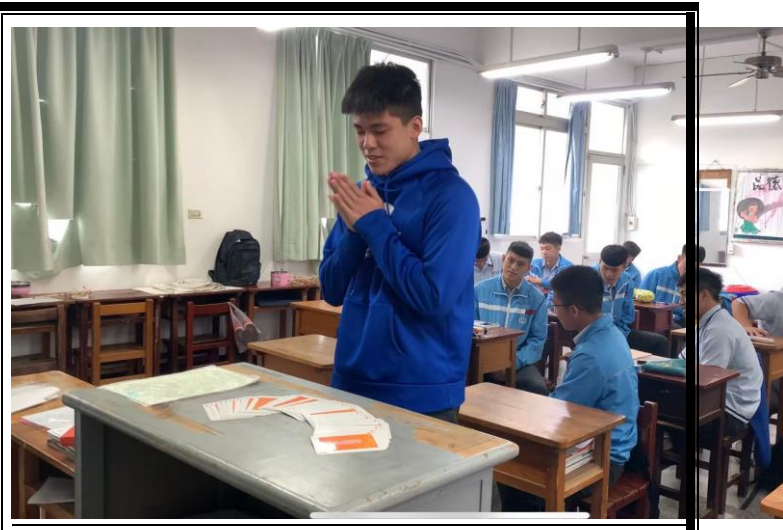
班導師將情緒魔法師活動帶回班級中，帶領同學們體驗