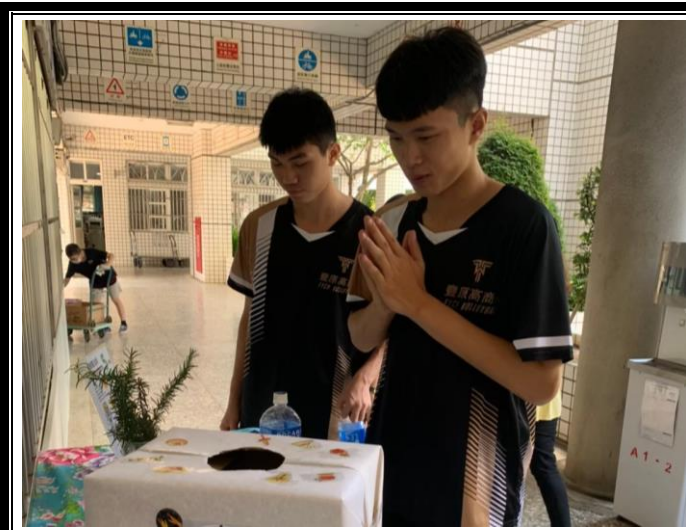
體育班的同學們來參與情緒魔法師活動