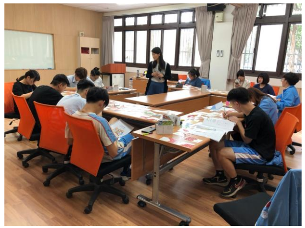
學生以「尋嘗日」生涯牌卡進行探索