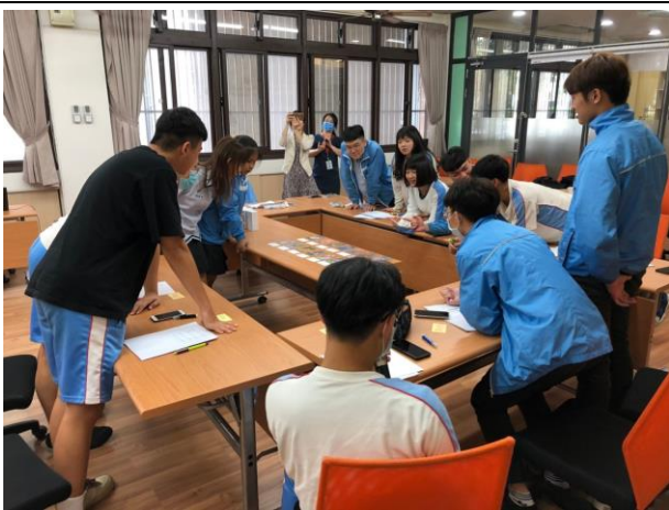
學生認真投入，用心挑選牌卡