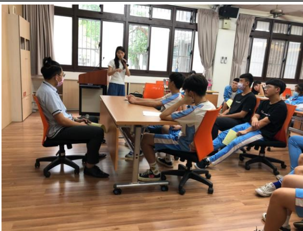
學生撰寫個人履歷後進行 升學/就業面試模擬