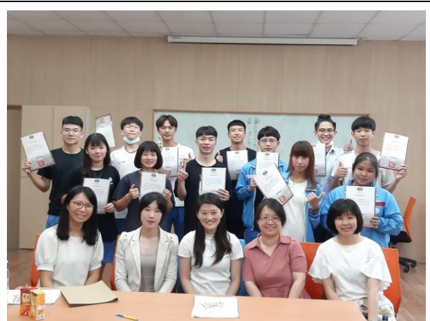
學生與講師大合照