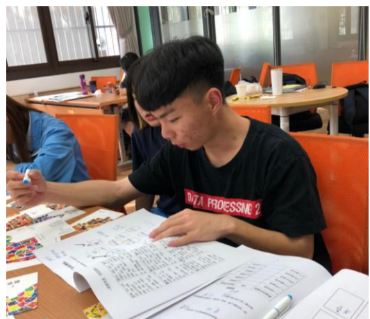
學生認真參閱資料，自我探索