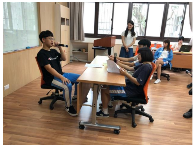
學生撰寫個人履歷後進行 升學/就業面試模擬