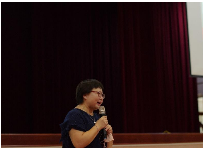
教育局劉主任黛麗致詞