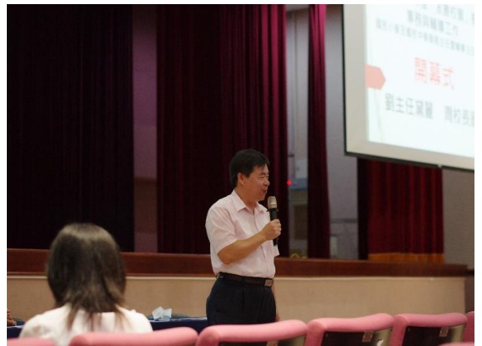
豐原高商周校長國生致詞