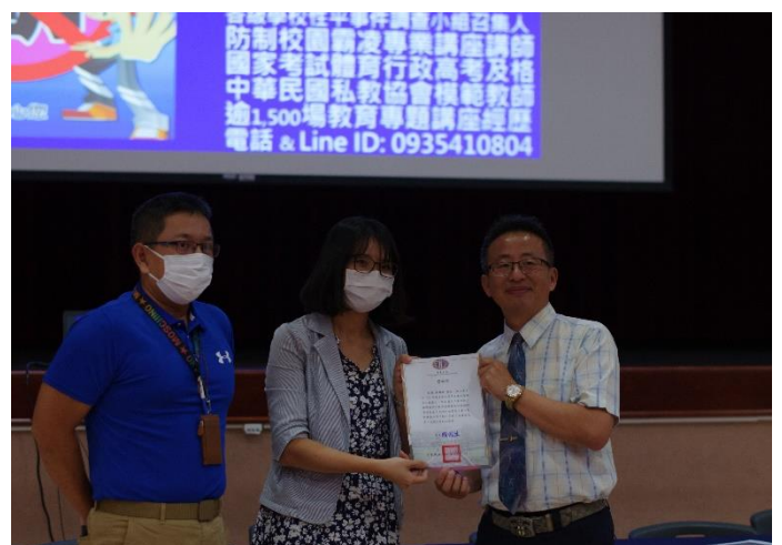
豐原高商輔導主任頒發感謝狀