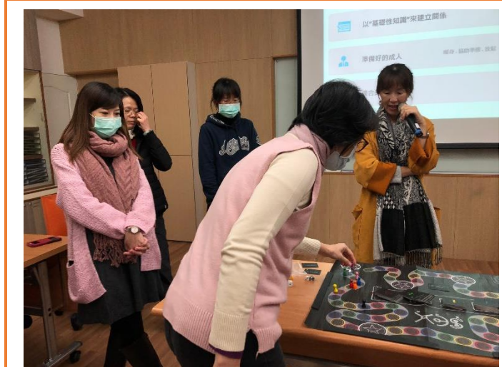
教師實際操作桌遊教學方式