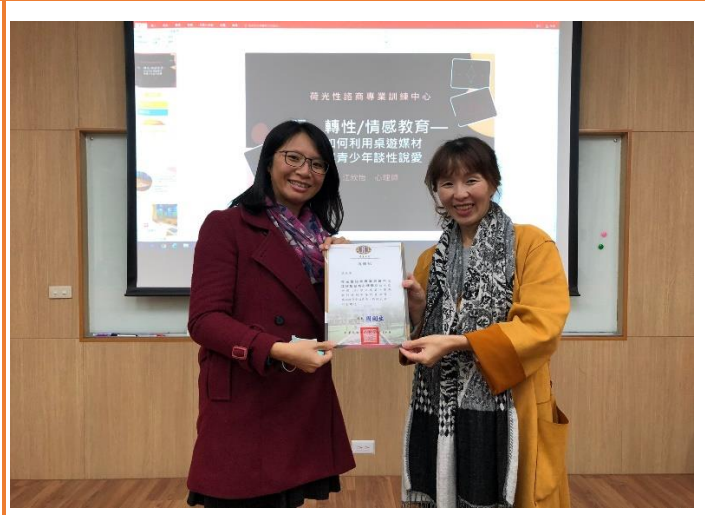
輔導主任頒發感謝狀