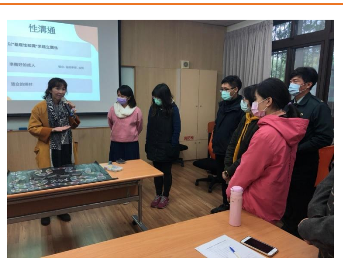
教師實際操作桌遊教學方式