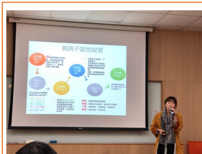
講師講解性平內容