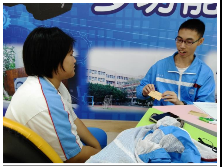
於最後一次團體給予彼此祝福小卡