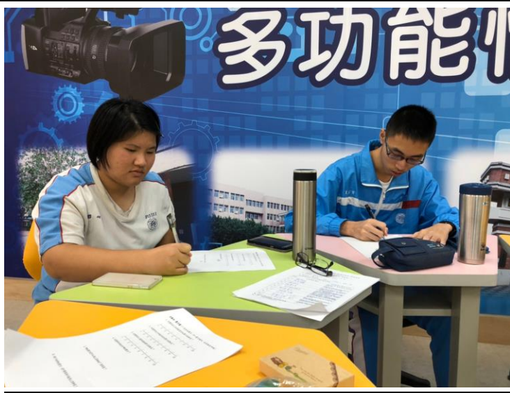
書寫學習單，進行活動後反思