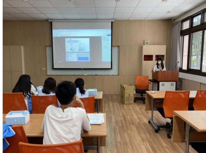
籌備會檢視各組簡報成果