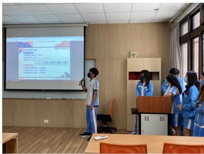
籌備會各組上台分享