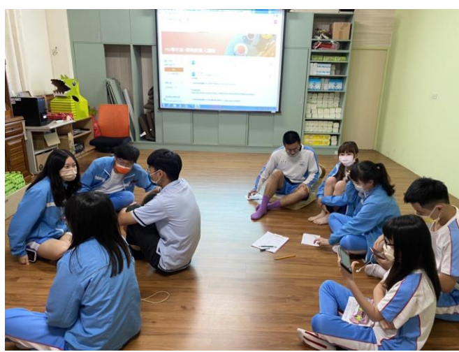
籌備會議分組討論

活動方式：輔導室招募統測表現優異的高三同學進行說書人的分組討論與訓練，先於校內進行兩次籌備會後，由各組錄製有聲版簡報影片，內容包含統測各科讀書方法與筆記、時間規劃、目標設定與壓力調適等主題，並將影片放置於雲端供高一高二各班老師於課程中運用。