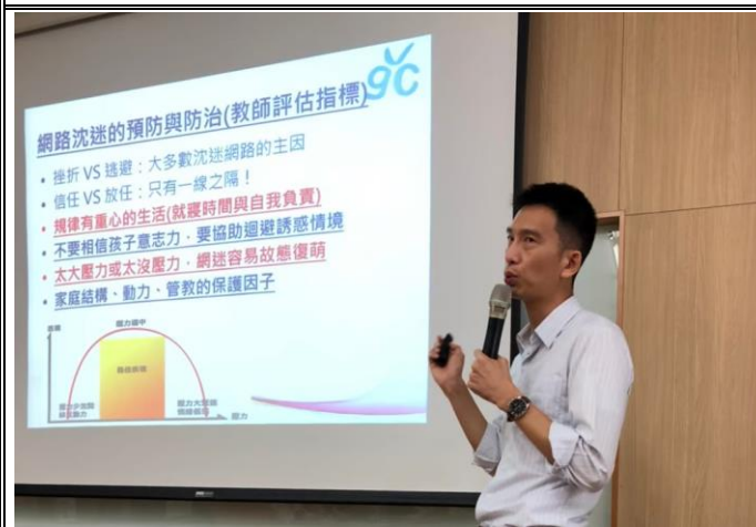
講師分享於網路沉迷議題上，教師可善用的評估指標