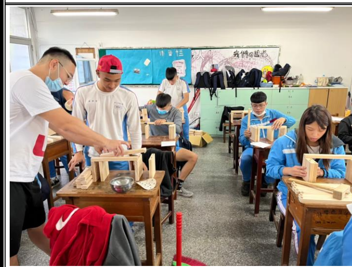
場次三「木藝創作體驗」，講師帶領學生利用木作手工工具製作活動書架